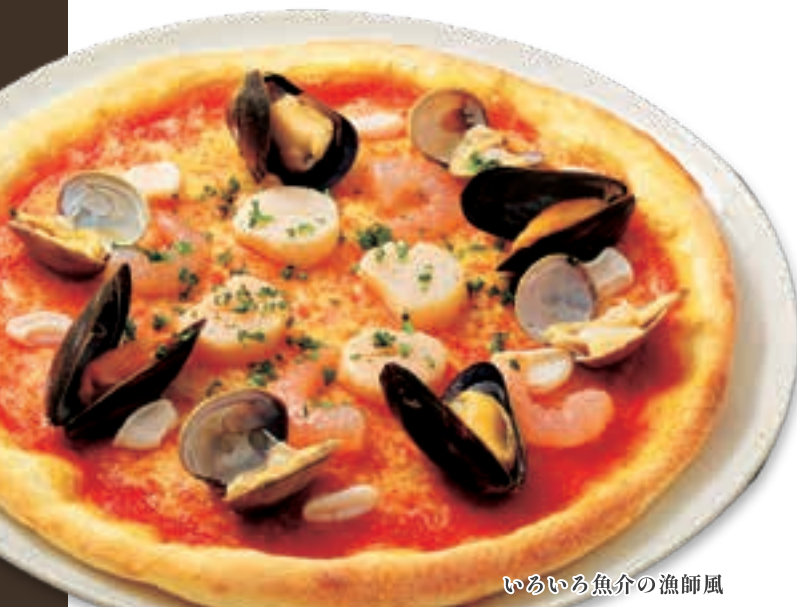
いろいろ魚介の漁師風