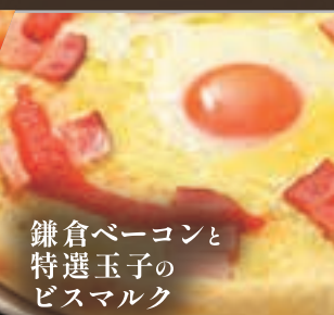
鎌倉ベーコンと 特選玉子の ビスマルク