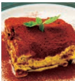
大人のティラミス