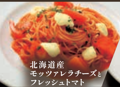
北海道産 モッツアレラチーズと フレッシュトマト