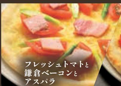
フレッシュトマトと 鎌倉ベーコンと アスパラ