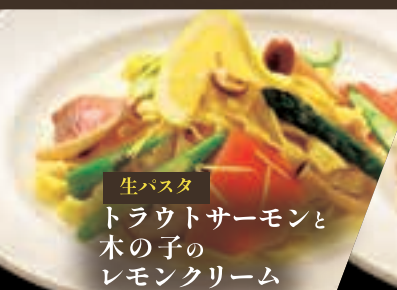
生パスタ トラウトサーモンと 木の子の レモンクリーム