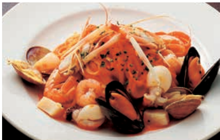
手長海老のペスカトーラ

国産しらすとしめじのペペロンチーノ 1,490円 (税込1,639円) 漁師さんから直送されたしらすがたっぷり。