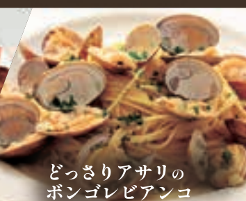
どっさりアサリの ボンゴレビアンコ