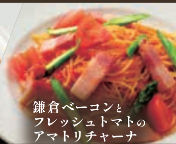
鎌倉ベーコンと フレッシュトマトの アマトリチャーナ