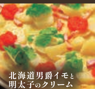
北海道男爵イモと 明太子のクリーム