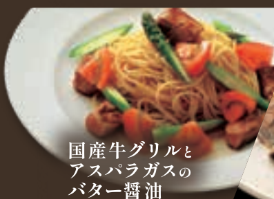
国産牛グリルと アスパラガスの バター醤油