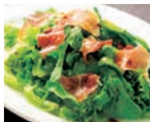
生ハムとルッコラのサラダ アンチョビドレッシング