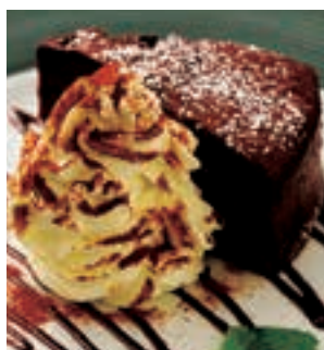
ビターなガトーショコラ エスプーマ生クリーム添え