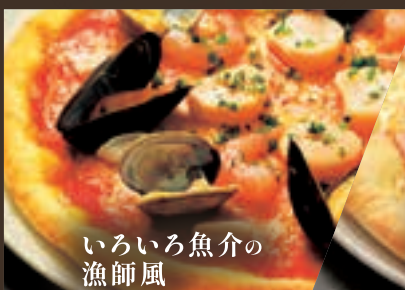
いろいろ魚介の 漁師風