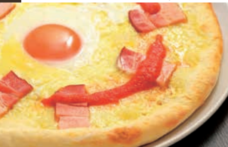
鎌倉ベーコンと特選玉子のビスマルク