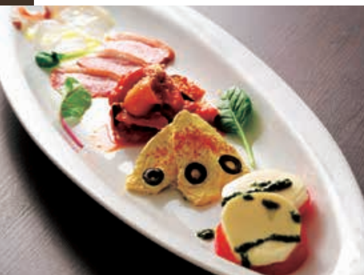
本日のおすすめ前菜5種盛