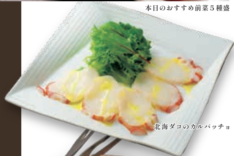
北海ダコのカルパッチョ