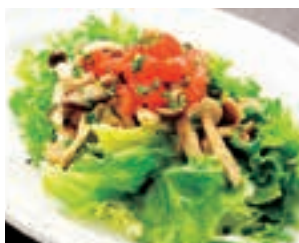
4種類の木の子が入ったサラダ わさび醤油ドレッシング