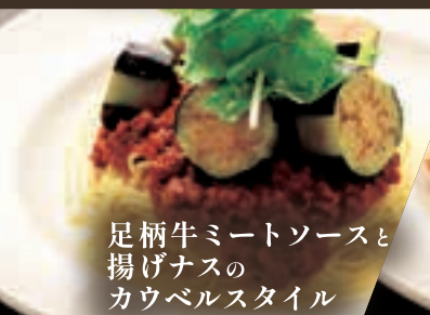
足柄牛ミートソースと 揚げナスの カウベルスタイル