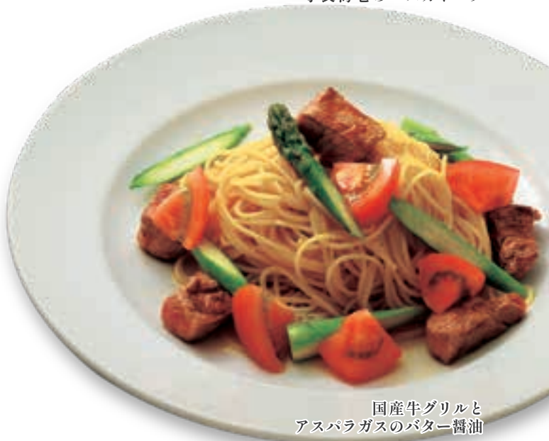
国産牛グリルとアスパラガスのバター醤油