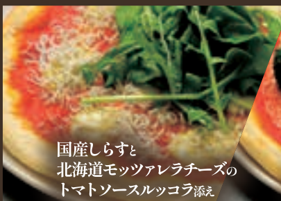
国産しらすと 北海道モッツアレラチーズの トマトソースルッコラ添え