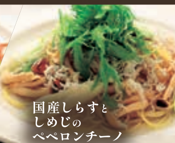
国産しらすと しめじの ペペロンチーノ