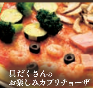
具だくさんの お楽しみカプリチョーザ