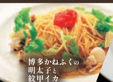
博多かねふくの 明太子と 紋甲イカ