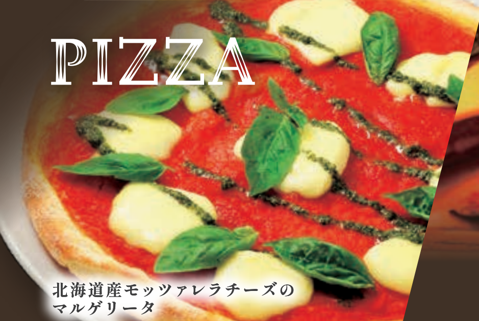
北海道産モッツアレラチーズの マルゲリータ