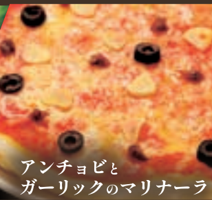
アンチョビと ガーリックのマリナーラ