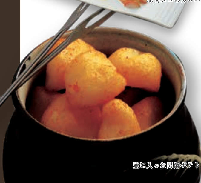
壺に入った男爵ポテトフライ