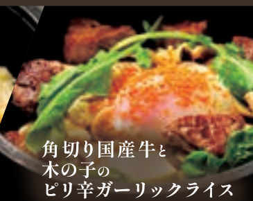
角切り国産牛と 木の子の ピリ辛ガーリックライス